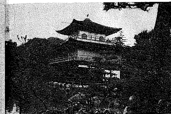
〈金 閣 寺〉

加茂川でよく思いだされるのは加茂川にかかる五条の大橋で、牛若丸と弁慶の話で有名である。五条橋近くに宿をとったので、その古戦場を見に行ったというわけで、この大橋に弁慶は夜毎に現われ通行人をおどし帯刀をかしめとっていたが、満願の百人目の深夜弁慶は、稚児姿の少年が笛を吹きながら近づくとを見て願ひかなえりとニヤリとした。そして近づくとその刀をおいていけといった。すると、その少年は弁慶が橋の欄干にたてかけてあった薙刀を蹴飛ばした。これを見た弁慶は大へんな怒り方でその薙刀を拾いとり、風車のように回わし牛若丸に切りかかった。しかし牛若丸の飛鳥のような早業にさんざんほんん奔され、遂にその大薙刀を橋上に棄て両手を突き頭を下げ主従のつかいをしたことはみんな知っていると。しかしその橋はそれから加茂川の氾濫で流されたが、残った欄干の一部が今でも使用されており、欄干の宝珠にきざされた五条大橋欄干五石橋・年号その他が記されている。