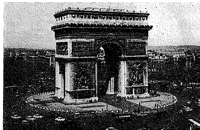
〈凱 旋 門 (フランス)〉

町を散策したがその日は日曜で、他の国もそうだが、商店は日・月は休日のため買物もできず、そこちち広場等を回って見たのはよかったが、パリの町は放射状送路が殆んどで、同じような町並のためとんでもない方向にいったようである。外国ではこんなときほんとうに困りもので、さいわいホテルの名刺を持っていた