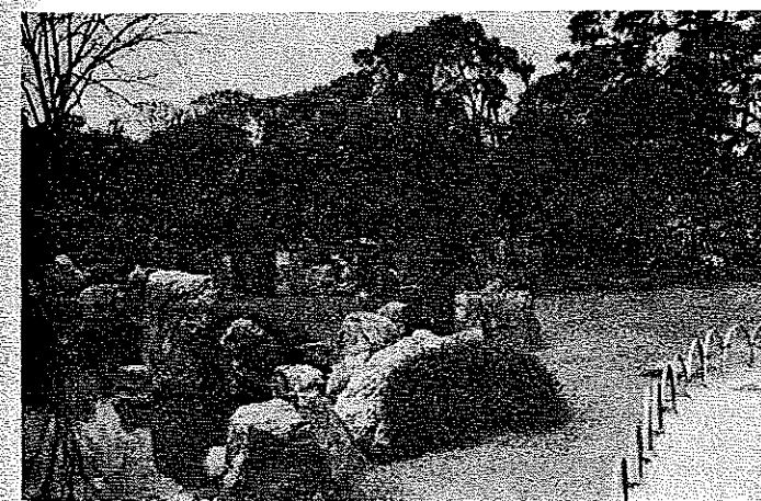
〈二 条 城 庭 園〉

京都はイタリアのフロレンスと寺の大きいことは共通していると先に述べたことがある。しかし寺ばかりでなく社の方も多い特色をもっている。神宮では平安神宮が最大規模が大きく、ここは桓武天皇を祭祀後に孝明天皇を合祀してある。二層様瓦葺の幸麗な建物で、参道の鳥居は日本一の大きいものといわれる。神域を囲む東・西・中の諸苑は広さ一万坪より春の桜の眺めはすばらしく、夏は花菖蒲、秋は萩と四季を通じ庭園の美に勝れているという。寺では各宗派本願寺を始め、知音院、清水寺、高台寺、方向寺等が知られ、特に方向等は豊臣家と徳川家とのいわくつきの