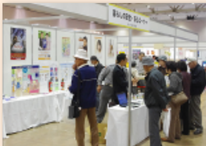
【札幌市消防局】 住宅防火・119番通報コーナー