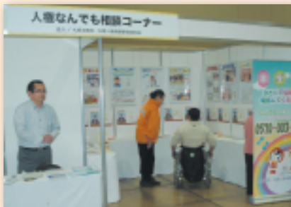
【札幌法務局・札幌人権擁護委員連合会】 人権なんでも相談コーナー