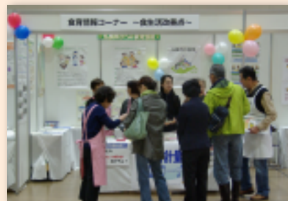
【札幌市保健福祉局障がい保健福祉部】 ご近所さんの手助け募集中 ～地域ぬくもりサポート～