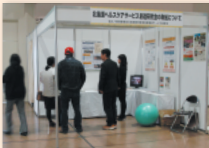
【経済産業省北海道経済産業局】 北海道ヘルスケア産業振興協議会の取組