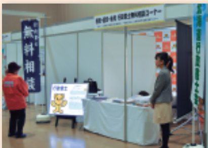
【北海道行政書士会札幌支部】 相続・遺言、後見相談コーナー